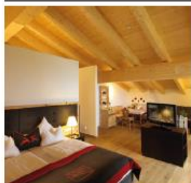
LICHTBLICK SUITE DE LUXE