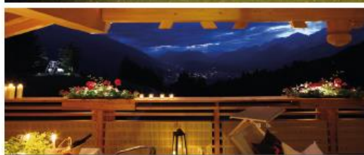
PANORAMABLICK INS INNTAL